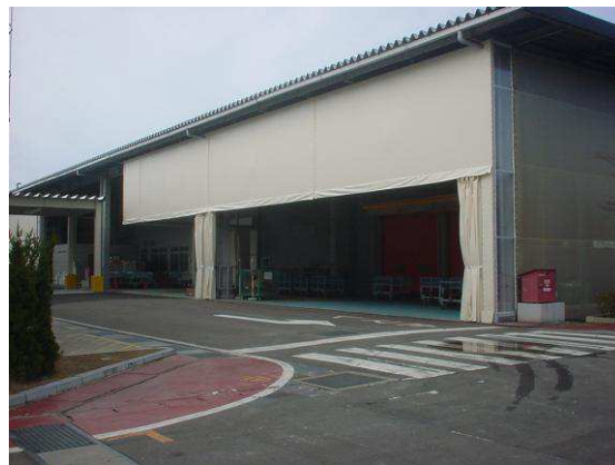
カーテン正面開放時