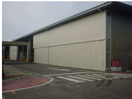
カーテン正面閉鎖時